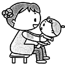
子どもをひざのにおせ、軽く抱き上げる。