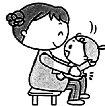
大きな動作でひざに座らせる。