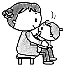
ひざの上にとろす。